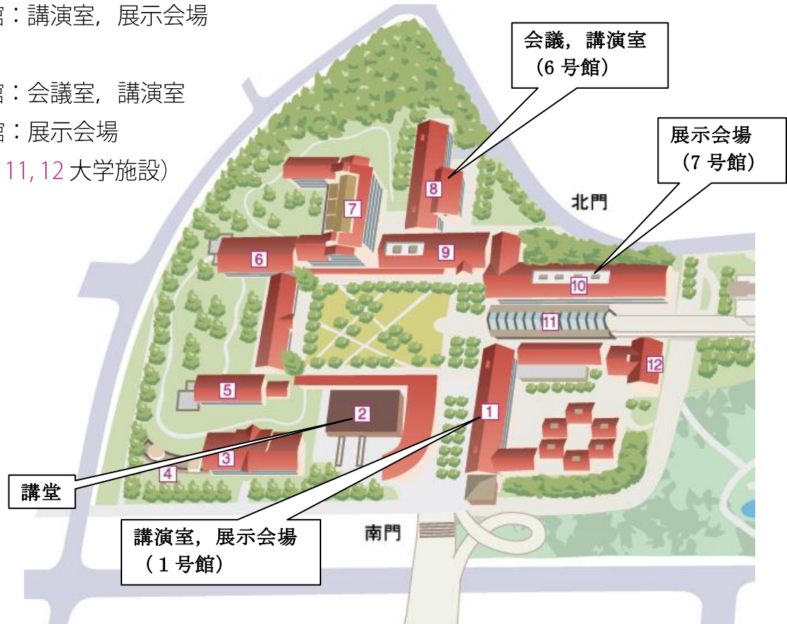
首都大学東京南大沢キャンパス 講演会会場（予定）