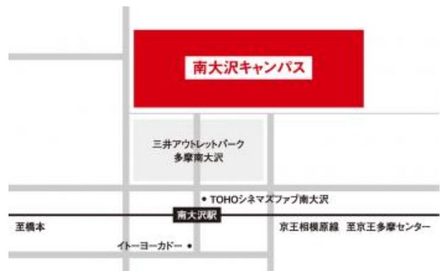
南大沢キャンパス交通アクセス