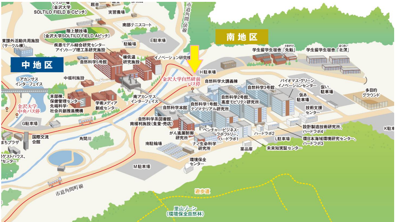
金沢大学自然科学本館